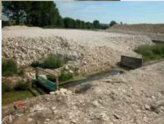
Fossé muni de filtres