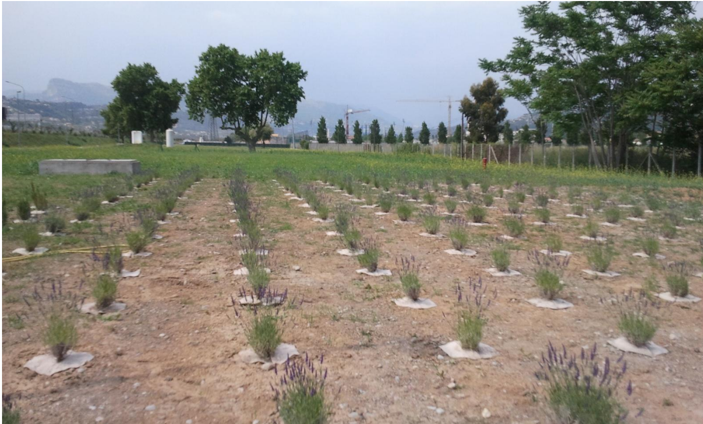
Captage des Prairies