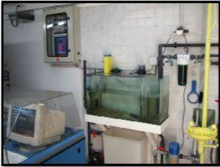
Figure 16 : Station d'alerte de Gairaut (Nice)